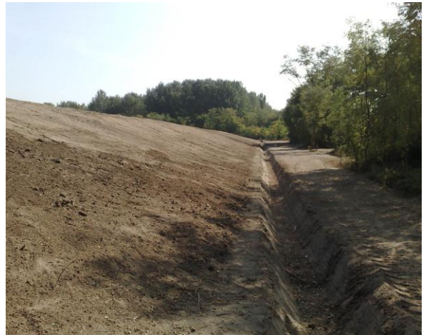
Hernád „Kommunális hulladéklerakó rekultiváció”