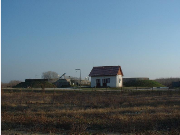
Alsónémedi szennyvíztisztító telep