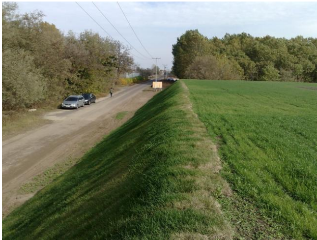
Táborfalva „Kommunális hulladéklerakó rekultiváció”