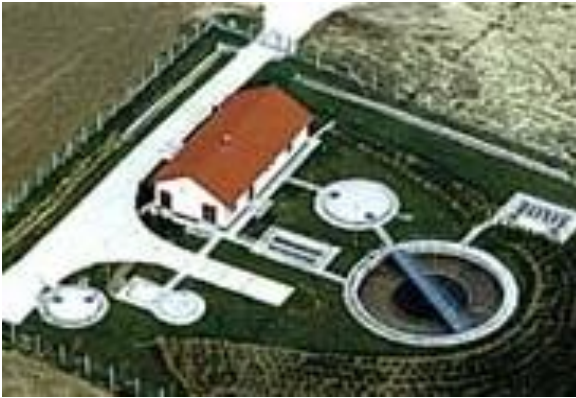
Szennyvízelvezetés és -tisztítás: Neszmély, Üröm, Esztergom, Fertőd, Soltvadkert, Tószeg, Vecsés, Gyál, Üllő, Solymár, Ács Szécsény, Örkény, Hernád, Piliscsaba,...