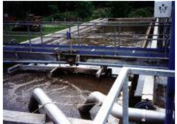
Gyömrő szennyvízelvezetés és -tisztítás