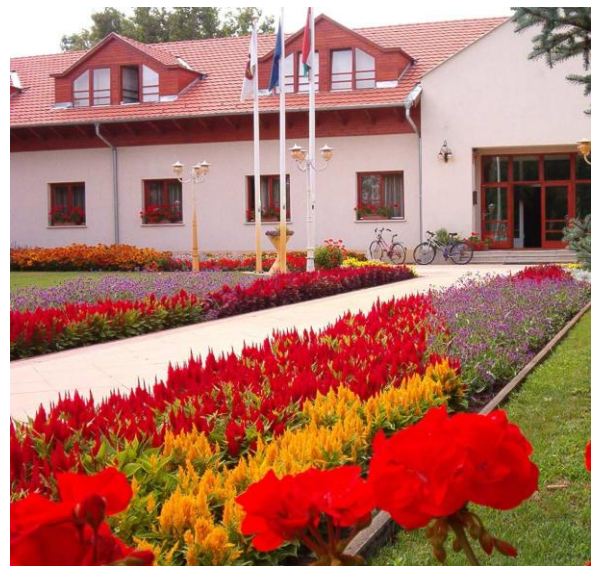
Csemő „Szociális Foglalkoztatású Épület”