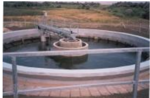
Nádudvar szennyvízelvezetés és -tisztítás