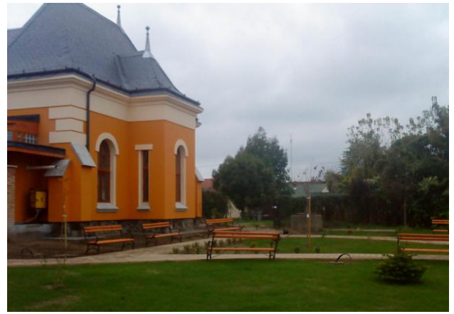
Szob „Városközpont integráció”