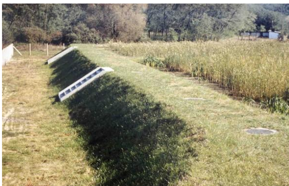
Szügy gyökérmezős szennyvíztisztítás