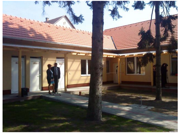
Szob „Családsegítő Program”