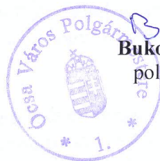
Bukodi Károly Bukodi Károly polgármester