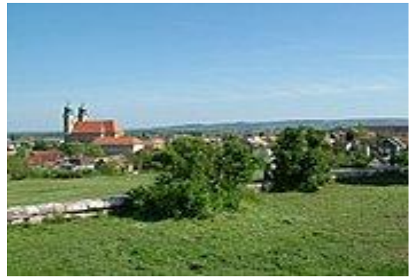
Zsámbék Kálvária domb közművesítése