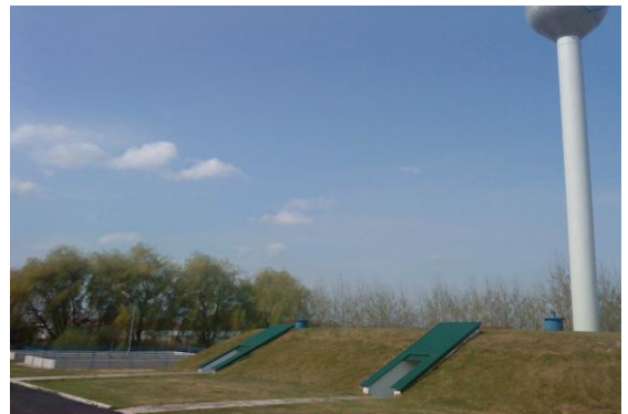
Újhartyán „Ivónvízminőség védelem”