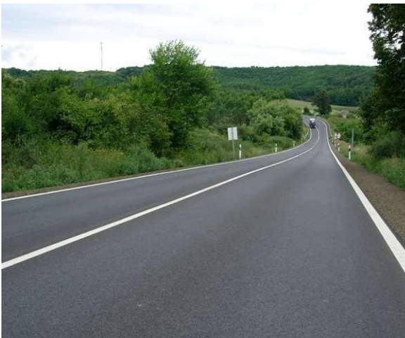
Útépités: Tápióság, Tököl, Jászberény