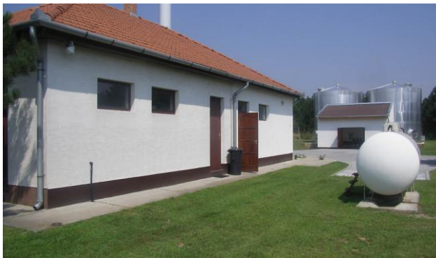
Újlengyel „Ivónvízminőség védelem”